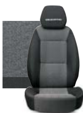
157 ŠEDÁ S ČALOUNĚNÝMI OPĚRKAMI HLAVY