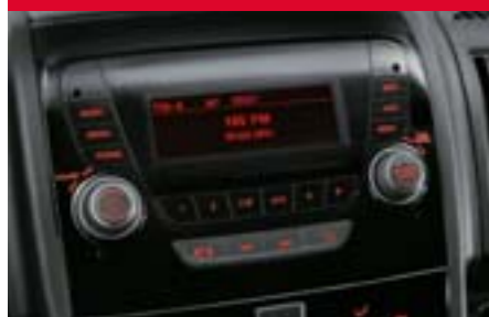
RÁDIO S BLUETOOTH*