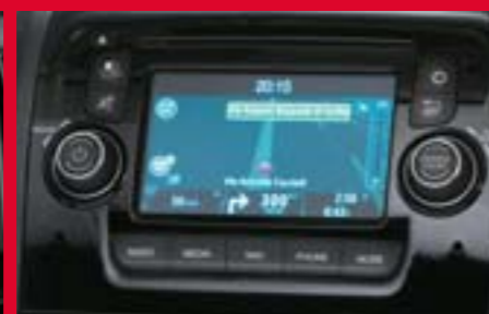
RÁDIO UCONNECT™ S VESTAVĚNOU NAVIGACÍ