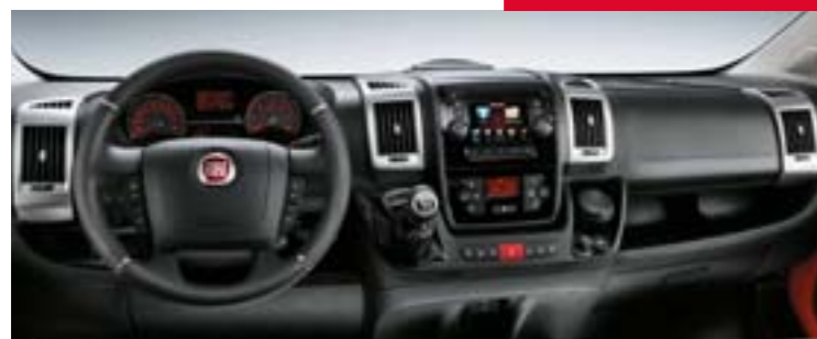
Palubní deska Techno 6BL