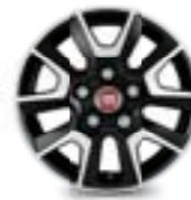
16" Ducato (opt. 431)