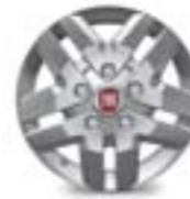
16" Ducato Maxi (opt. 208)