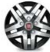
16" Ducato Maxi (opt. 432)