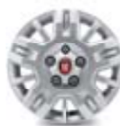
15" Ducato (opt. 108)