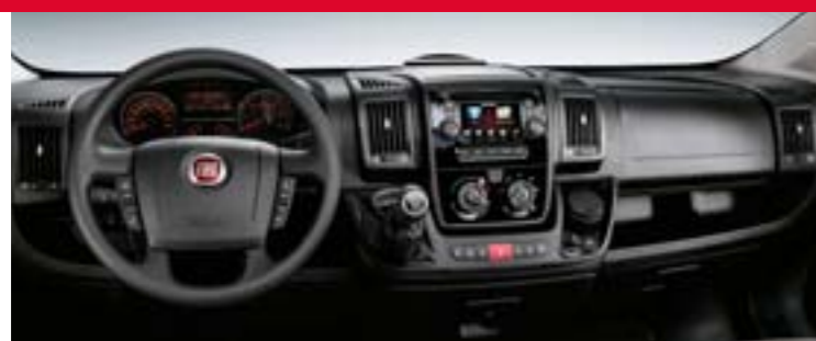
Palubní deska Classic