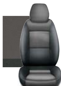
266 ŠEDÁ IMITACE KŮŽE